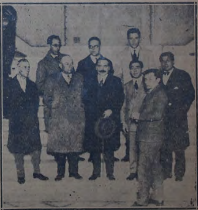
LOS MIEMBROS DE LA JUNTA EJECUTIVA, ACOMPAÑADOS POR NUESTRO ENCARGADO DE LA SECCION "INTERIOR"