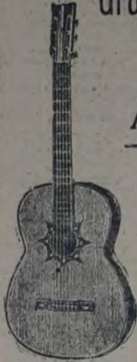
Guitarra de concierto, con truida con maderas elegidas, caja de algarrobo, tapa armónica importada, lujosamente adornada en su alrededor con mosaicos finos, boca estrecha con finas incrustaciones de nácar, $ 60. Otras desde . . . . . $